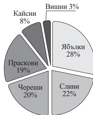
Производство на овощни култури в България за 2021 г. (в тонове)

10. Анализирайте информацията от кръговата диаграма и определете грешното твърдение?