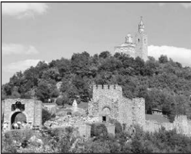
Хълмът Царевец във Велико Търново;